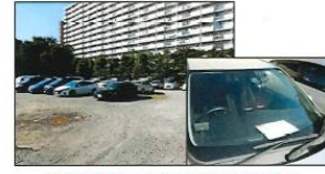
駐車場台数と通勤車両台数を増やす