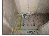
サーキュレーターや排風機を設置して、室内の空気を戸外へ排気