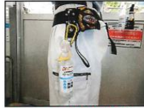
アルコール消毒液を携帯し、適宜、消毒を行う