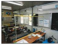
休憩所は換気を行い、仕切りを設ける