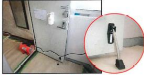
ドアストッパーを用意し、玄関扉を開放する