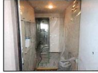
ビニルフィルム養生により区画する