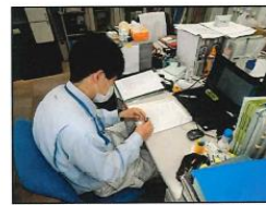
現場管理者がチェックシートにより、作業員全員の体調を確認する