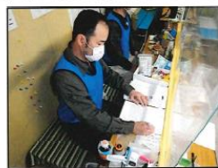
始業前に、体調管理チェックシートに記入し、体調を管理者に報告する