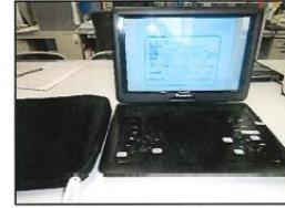
DVDが再生できない住戸にはポータブルプレイヤーを貸出し