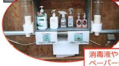
消毒液やうがい薬、ペーパータオルを設置