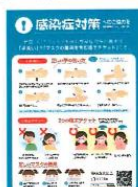
感染症対策ポスターの掲示（手洗い）