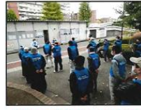
朝礼は間隔をあけて並列する