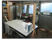
会議テーブルに仕切りを設ける