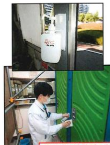
事務所や休憩所の入室時に手指の消毒を行い、共用スペースを定期的に消毒する