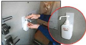
玄関ドアにアルコール消毒液を配置し、出入りの際に手指を消毒する