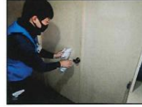
作業で触れたドアノブや照明スイッチなどを定期的に消毒する