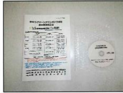
工事内容の説明をDVDに収録